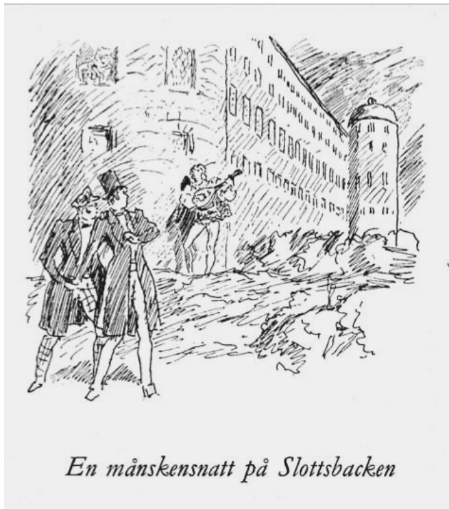
En månskensnatt på Slottsbacken

Kontakta oss om du vill ge ett frivilligt bidrag – hemsidan kostar – eller önskar Gluntunderhållning vid privat tillställning, konferens eller liknande möten. Vi försöker då att hjälpa dig med sångare och pianist.