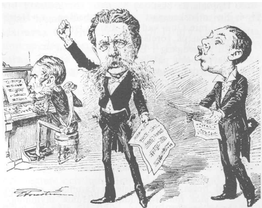
Magistern och Glunten. (Teckning av E. Forsström).